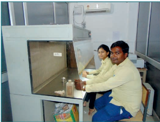
B T Lab