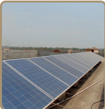
सौर ऊर्जा उपकरण का प्रयोग।