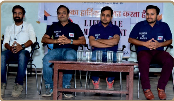
"Bunch of Fools"- Raipur