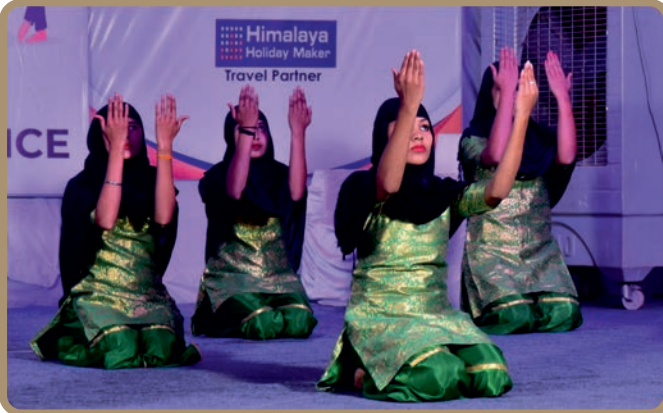
We all are one