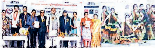
उत्कृष्ट छात्र-छात्राएं एवं प्राध्यापक सम्मानित