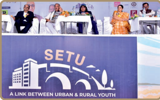
Proud Moment for all of us