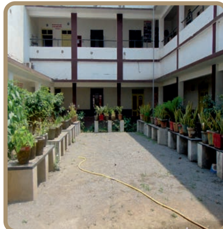
ऑक्सीजोन वातावरण निर्मित