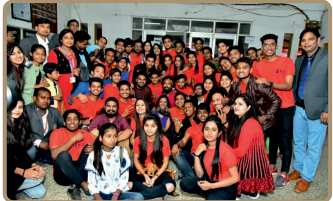
All our enthusiastic volunteers with the musical band "Kabir Café"