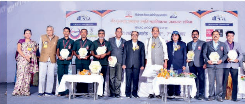
सेठ फूलचंद अग्रवाल स्मृति महाविद्यालय, नवापारा राजिम