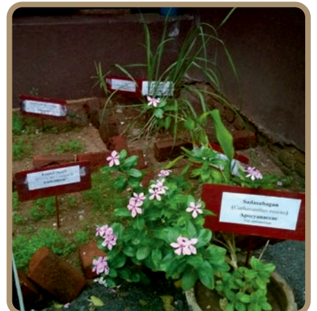
औषधि पौधों का रोपण एवं संरक्षण